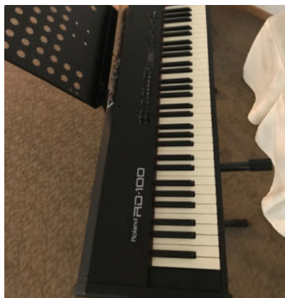
E-Piano 2: Roland RD-100