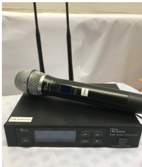
Mikro kabellos Tbone free solo DR823 MHz