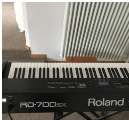
E-Piano 1: Roland RD-700sx