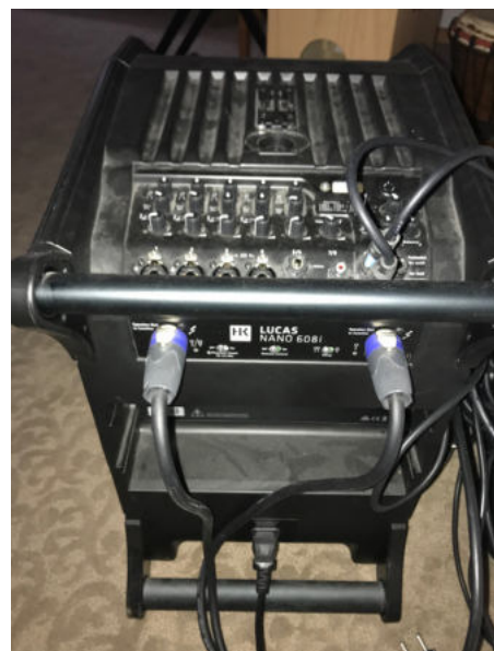
Lautsprecher HK LUCAS NANO 608i plus zwei dazugehörige kleine Boxen