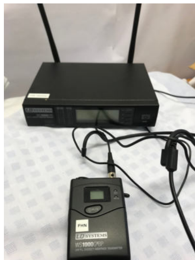
Headset LD Systems, WS1000 G2BP