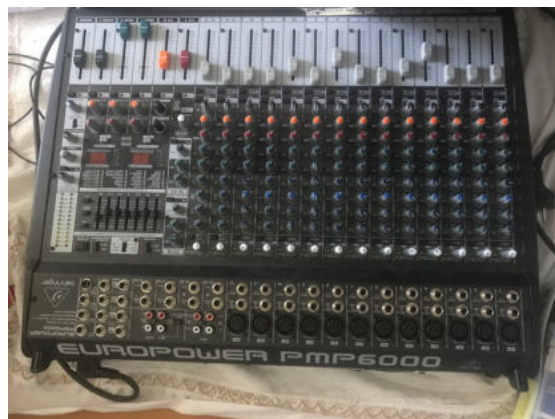
Mischpult: Europower PMP 6000